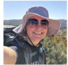
Alicia Swanepoel Media

Baie dankie vir julle bereidwilligheid om julle persoonlike tyd aan Ndaba af te staan. Julle bydrae word raakgesien en opreg waardeer.